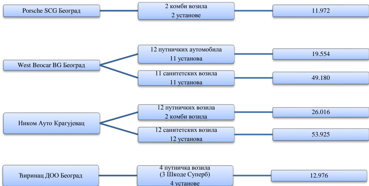
Графикон број 3: Приказ дела набављених аутомобила од стране установа за социјалну заштиту у хиљадама динара

У решењима за пренос средстава установама је наложено да у року од 15 дана доставе извештај о наменском утрошку средстава. Увидом у тестирану документацију утврђено је да 39 установа којима су средства пренета у децембру месецу доставило извештаје, након отпочињања ревизије, односно у мају и јуну месецу 2017. године. Министарство није извршило контролу утрошка средстава за износ од 245.024 хиљаде динара, јер установе нису у прописаном року доставиле извештаје о наменском утрошку средстава са пратећом документацијом као доказом. Министарство није предузело мере у случајевима када установе нису доставиле извештаје о утрошку средстава, тако што им није обуставило даљи трансфер средстава у складу са Директивом о међусобним обавезама и одговорностима Министарства и установа социјалне заштите правдању средстава од стране установа социјалне заштите.